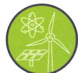
Production d'électricité Énergies renouvelables