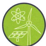
Production d'électricité Énergies renouvelables