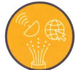
Réseaux de télécommunication