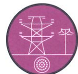
Infrastructures et réseaux électriques