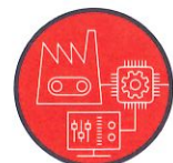
Bâtiments connectés Industrie