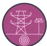
Infrastructures et réseaux électriques